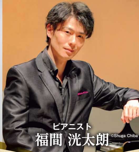
ピアニスト 福間 洸太郎